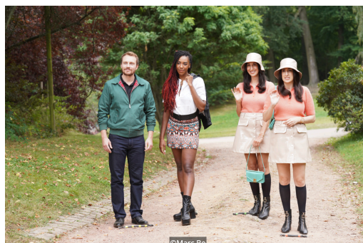
Des enfants devenus grands