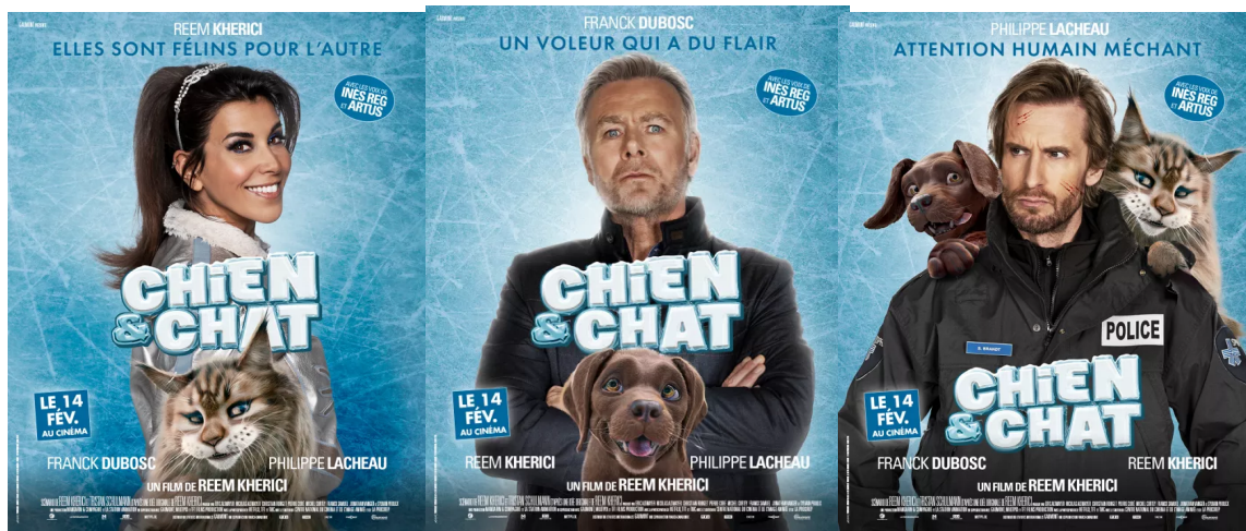
Tous les personnages et leur caractéristique