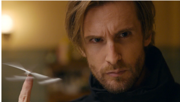
Briandt, le « policier » à la poursuite du rubis, de Jack et de Chichi