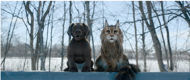
Chichi et Diva en pleine aventure