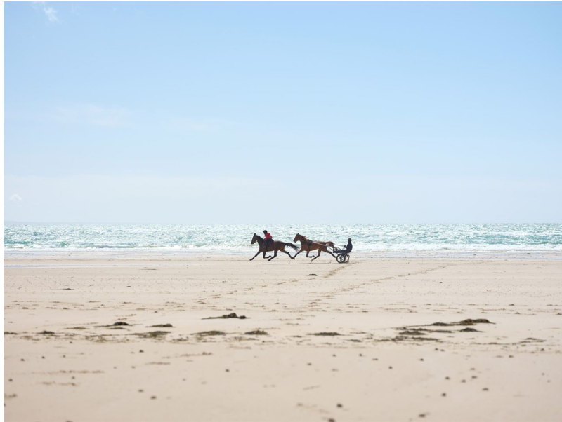
Les courses folles entre Zoé et son père sur une plage de Normandie